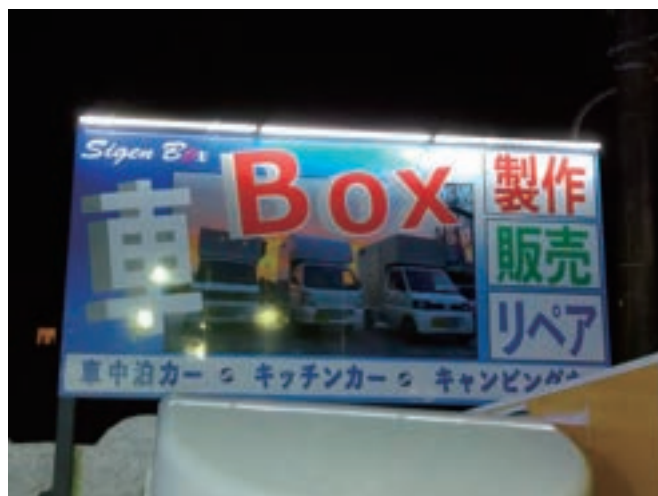
幅約 3600× 高さ約 1800